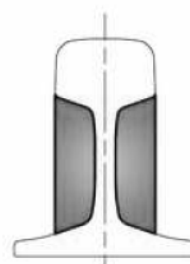
WERSJA 4 - "WWL WWP" szyny: 49E1 (S49)